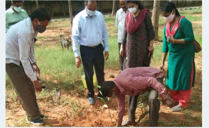
ಕನ್ನಮಂಗಲ ಸಸ್ಯಶಾಸ್ತ್ರೀಯ ತೋಟ