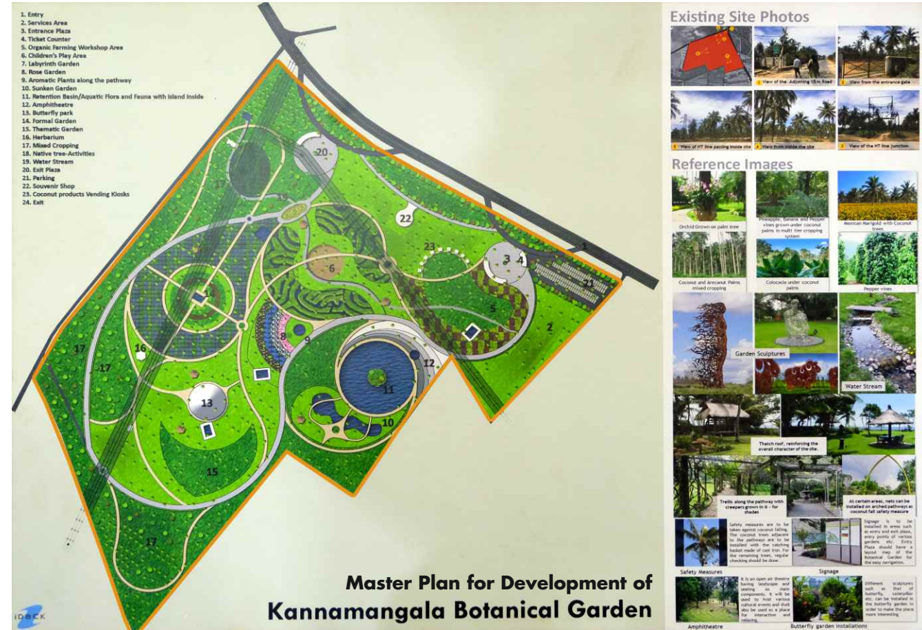
Master Plan for Development of Kannamangala Botanical Garden